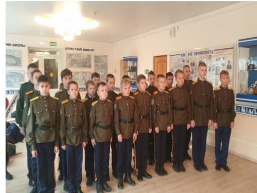
Классы казачьей направленности 1Б, 2Б, 6В, 11В