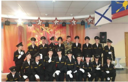
Морские классы 5В, 8В, 9В, 10В