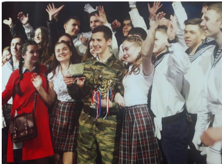
победа в конкурсе "Российской армии будущий солдат"