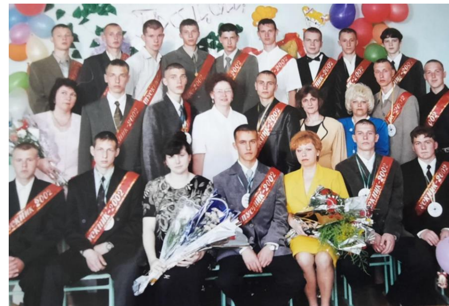
первый выпуск оборонно-технического класса 2002 год