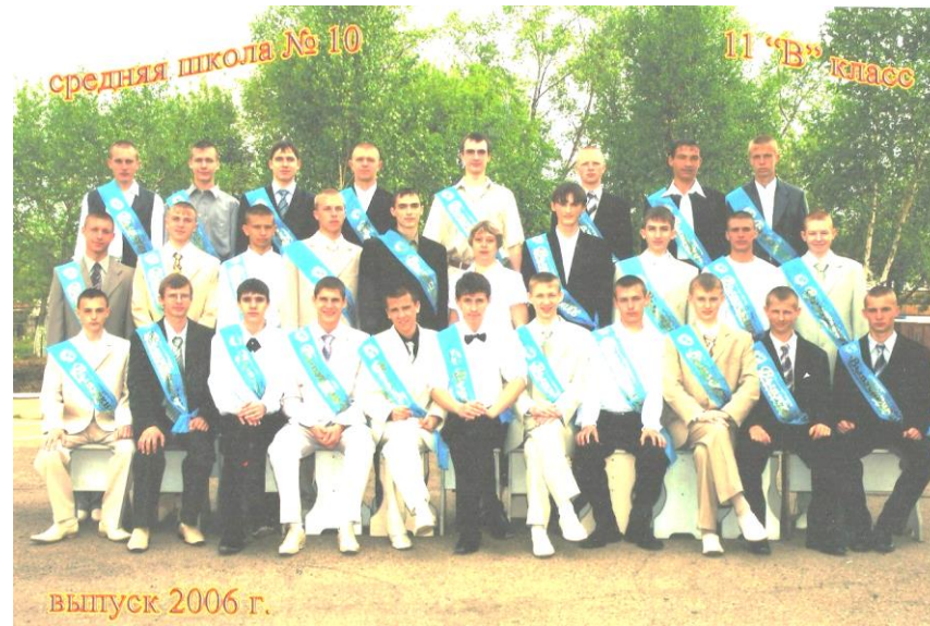
выпуск 2006 г.